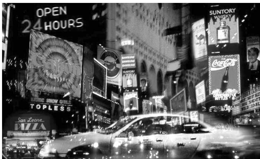
Современный человек живет в мире рекламы

- Студентов даже первого курса можно сделать настоящими профессиональными рекламщиками. Но только при постоянной практике. Кстати, сту-