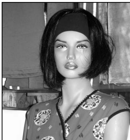
Универмаг «Маяк», манекен:

Поливаю комнатные растения и кормлю рыбок в аквариуме, чищу картошку, мою посуду, в общем, занимаюсь своими делами. Иногда даже успеваю в магазин сходить. К рекламе отношусь абсолютно равнодушно, я уже к ней привыкла.