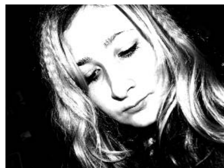
Кастинг в "Вереске" не уступает отбору "Фабрики звезд"