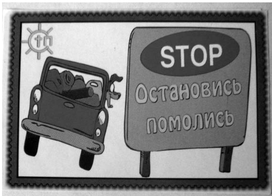
Секты всерьез намерены «глаголом жечь сердца людей»

Церковь Сатаны распространяет листовки с "радующей" православных информацией о начале своей деятель-