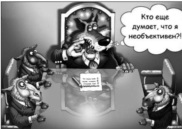
Как тут не быть самоцензуре?

самоцензура или нравственная культура самоограничения?