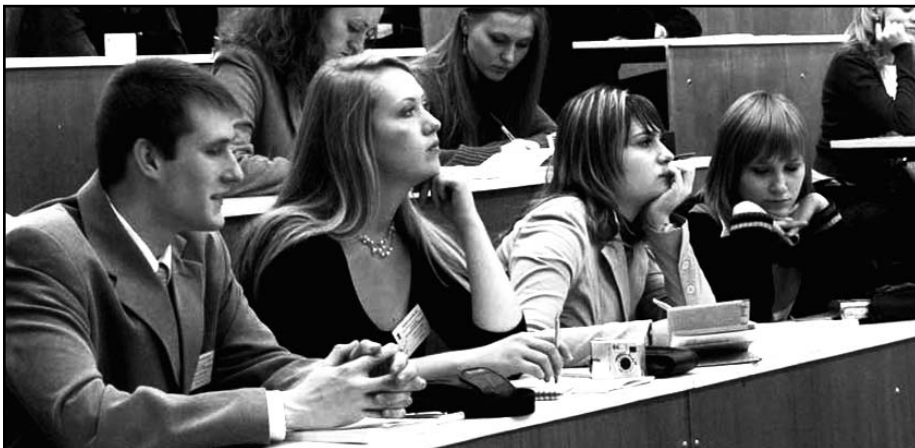
На пленарном заседании: белгородская делегация внимательно слушает докладчиков