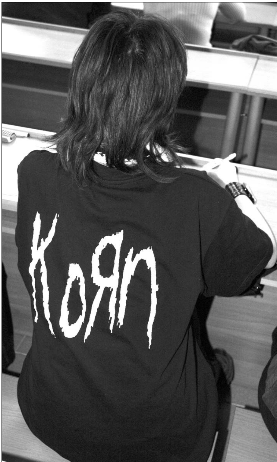
Будущим журналистам со студенческой скамьи приходится думать: как не навредить аудитории?

На лекциях и семинарах по основам творческой деятельности журналиста, основам журналистики мы часто обсуждаем болезненные вопросы развития нынешних СМИ. Говорим о насилии, демонстрируемом в телэфире в самое разное время суток, о языковой агрессии (нецензурной, бранной лексике, оскорблениях). А почему именно это становится темой обсуждения? Это ли главная проблема?