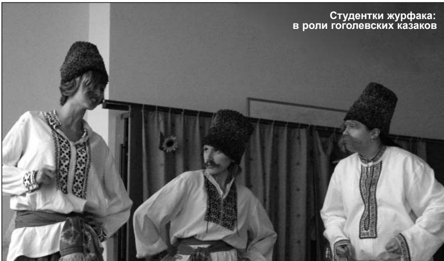
Студентки журфака: в роли гоголевских казаков