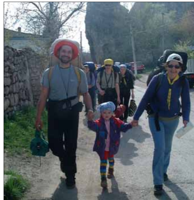
С этого похода в Крым всё и началось...

- Дым костра, палатки, всем знакомые песни и друзья, которые рядом. Что ещё нужно для полного счастья в майские праздники? - говорят следопыты.