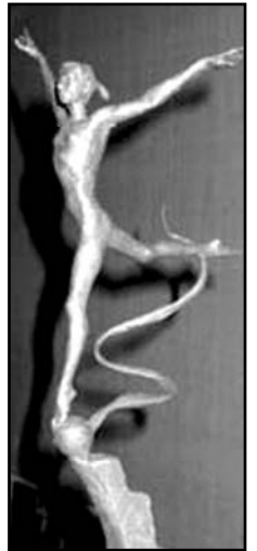
Один из проектов скульптуры "Гимнастка".

свое решение уже стало отличительной чертой корпусов БелГУ, построенных в последние годы. На площади же перед зданием Светлану Хоркину увековечат в бронзе. Скульптура будет называться "Гимнастка". Кстати, сама Светлана принимала непосредственное участие в создании проекта комплекса, строительство которого должно закончиться в конце августа 2006 года. Так