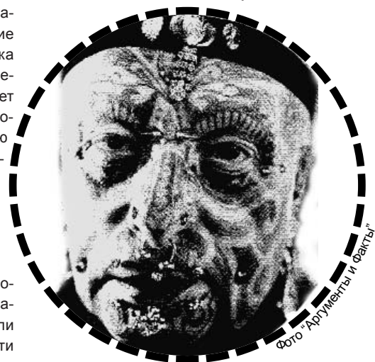
фото "Архумель и Файты"

Но скарификация – это еще не самый кровавый метод изменения себя. Есть лю-